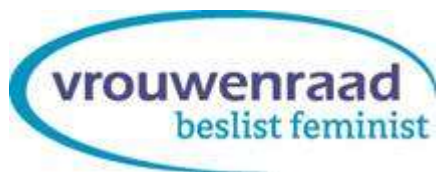
Figuur 1: logo Vrouwenraad